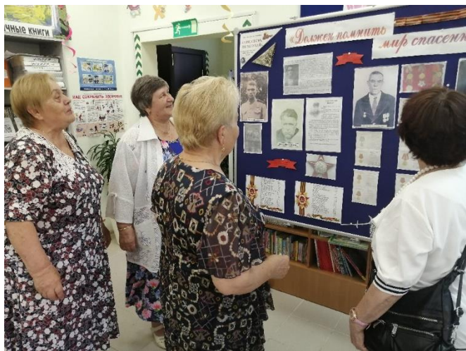
Никитовиче и многих других героях-земляках.

были представлены истории подвигов пяти героев Курской битвы - «бессмертного» сержанта Зиямата Хусанова, участника пяти войн Ивана Охлобыстина, танкиста Григория Пэнэжко, патриарха Пимена, Виталия Попкова - прототипа Маэстро из фильма «В бой идут одни «старики». Завершая беседу, библиотекарь прочитала главу «Курская баталия» из книги Аллы Суховой «Дети войны».